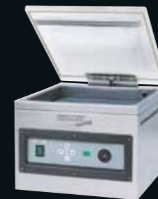
Vakuumpackungsmaschine von Komet – Vacuboy Allround-Maschine