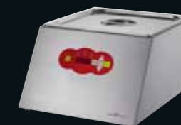
Komet-Domnick Gourmet-Thermalisierer Ariane, 14 Liter Wasserbad, 2/3 Gastronorm