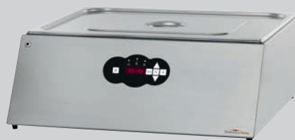
NONA: 51 Liter Wasserbad 2/1 Gastronorm B/T/H (mm): 670 x 720 x 250 Stromanschluss (V/Ph/kW): 230/1/3,7