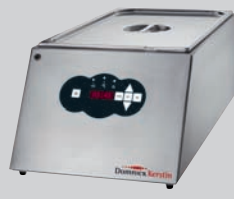
KERSTIN: 23 Liter Wasserbad 1/1 Gastronorm B/T/H (mm): 350 x 720 x 250 Stromanschluss (V/Ph/kW): 230/1/1,4