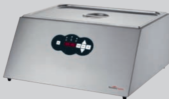
SOPHIE: 23 Liter Wasserbad 1/1 Gastronorm B/T/H (mm): 550 x 510 x 250 Stromanschluss (V/Ph/kW): 230/1/1,4

Besuchen Sie uns auf folgenden Messen und überzeugen Sie sich von den Vorteilen der KOMET-Vakuum-Verpackungsmaschinen: INTERGASTRA, STUTTGART 11.02. – 15.02.2012 INTERNORGA, HAMBURG 09.03. – 14.03.2012 ANUGA FOOD TEC, KÖLN 27.03. – 30.03.2012